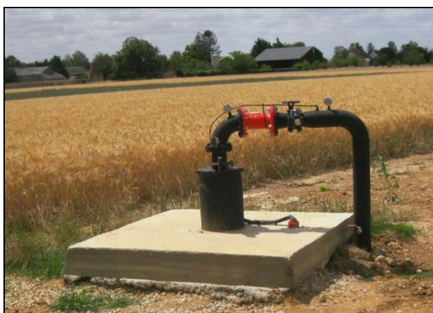
Exemple d'aménagement de tête de forage avec équipement d'hydraulique à l'exhaure dédié à l'irrigation de cultures (Photographie : GéoSen – Juil-20)